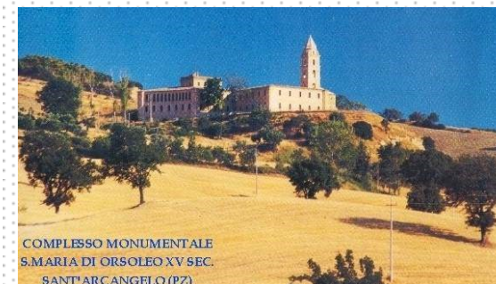
COMPLESSO MONUMENTALE S.MARIA DI ORSOLEO XV SEC. SANT'ARCANGELO (PZ)

24 e 25 ottobre 2014 Complesso Monumentale Santa Maria di Orsoleio Sant'Arcangelo ( PZ )